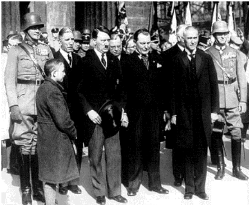
A. Hitler im März 1933

Die direkte Folge davon war, daß die deutsche Regierung am 1. April einen eintägigen Boykott jüdischer Geschäfte in Deutschland ankündigte. Propagandaminister, Dr. Joseph Goebbels , kündigte an, daß wenn nach dem eintägigen Boykott keine weiteren Angriffe auf Deutschland gemacht würden, der Boykott auch beendet würde.