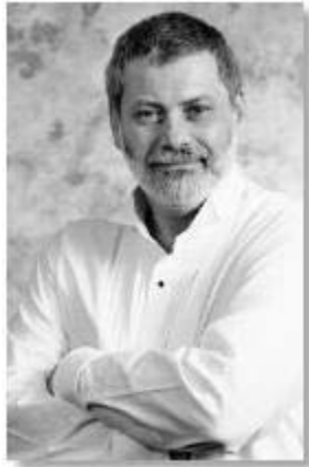
Der Jude Edwin Black belegte die wirtschaftlichen Auswirkungen des jüdischen Wirtschaftskrieges gegen das Deutsche Reich

Die jüdischen Führer blufften nicht . Der Boykott war nicht nur ein metaphorischer Kriegsakt: Er war ein gut ausgedachtes Mittel, um Deutschland als politische, soziale und wirtschaftliche Einheit zu zerstören. Der weitreichende Zweck des jüdischen Boykotts gegen Deutschland war, es in den Bankrott zu treiben mittels der Reparationszahlungen, die Deutschland nach dem ersten Weltkrieg auferlegt wurden, und Deutschland entmilitarisiert und verletzlich zu halten.