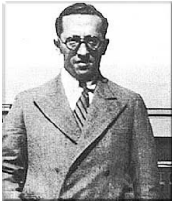
Chaim Arlosoroff, 1933 von vermutlich zwei Arabern ermordet

Während die deutschen Juden auf die Erhaltung jüdischer Rechte zielte - symbolisiert durch den jüdischen Wirtschaftsboykott gegen das nationalsozialistische Deutschland, konzentrierte sich das zionistische Interesse darauf, die Krise zur Steigerung der Einwanderung nach Palästina zu nutzen. Haupthindernis für die Emigration aus Deutschland war die deutsche Gesetzgebung, die die Ausfuhr von Fremdwährungen verbot. Diese Gesetze waren schon während der Weltwirtschaftskrise erlassen worden, um die Kapitalflucht zu unterbinden, aber es gab noch einige Schlupflöcher, die die deutschen Zionisten in Deutschland und in Palästina nutzten.