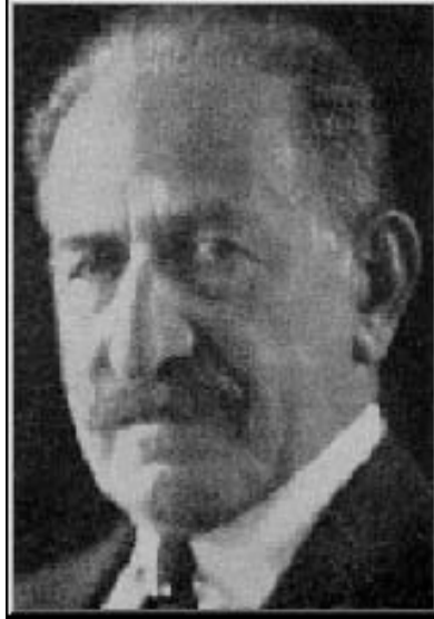
Samuel Untermyer war Kopf des jüdischen Krieges gegen das Deutsche Reich

Sie wurde unter der Schirmherrschaft der selbsternannten World Jewish Economic Federation abgehalten, deren gewählter Präsident der berühmte New Yorker Rechtsanwalt und politische Agent Samuel Untermyer war.